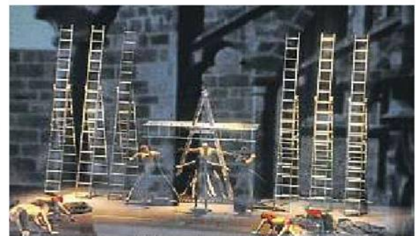
Die Traumfabrik zeigte Faust als gewaltige Inszenierung aus Tanz, Bildern und Musik – aber ohne Worte.